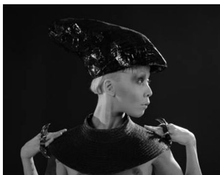
© Günther Schaefer, Pechur Deperles, (O.i.F.)