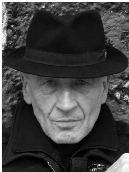
Günther Schaefer, © Java Guidi, (O.i.F.)