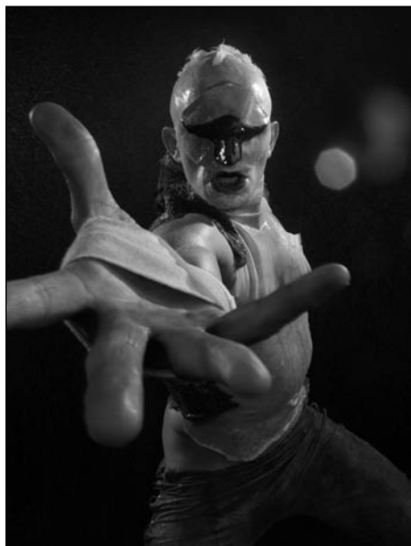
© Günther Schaefer, Frederic Krauke, (O.i.F.)