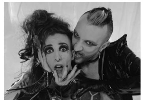
© Günther Schaefer, Rula El Bahr & Petra Flurr, (O.i.F.)

Günther Schaefer behandelt die zunehmende Gentrifizierung, die unübersehbar auch von diesen Stadtteilen Besitz ergreift. Die Beispiele der Nachwendezeit in den 90iger Jahren im Bezirk Mitte sowie in den 2000er Jahren im Prenzlauer Berg mögen als Exempel dienen wie die rapide Gentrifizierung junger Kreativschaffende, die das Flair und das Straßenbild dieser Bezirke maßgeblich geprägt haben, gesellschaftlich an den Rand gedrängt und letztendlich, einer existenziellen Problematik folgend, aus diesen Bezirken verdrängt wurden. Seit geraumer Zeit lässt sich diese Entwicklung tendenziell auch in den erwähnten drei Stadtteilen erkennen.