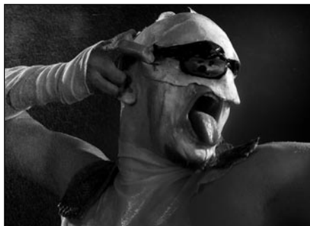
© Günther Schaefer, Frederic Krauke, (O.i.F.)