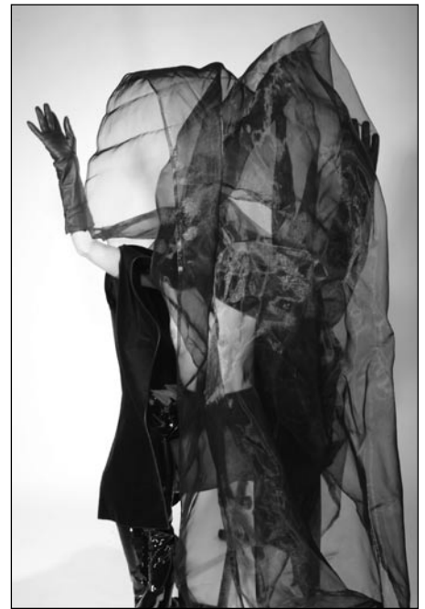
© Günther Schaefer, Pecheur Deperles, (O.i.F.)